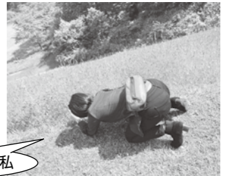
スマホで写真を撮っている私

大石田に引っ越して3ヵ月ほどですが、不安や戸惑い以上に楽しいことばかり!この新鮮な気持ちや、毎日元気で超☆ハッピー、みたいな姿を見て頂くことで、大石田のみなさんの笑顔や、何かを感じたり考えたりするきっかけになれたらいいなあ。これからお騒がせすることが多々あるかと思いますが、どうぞよろしくお祈りします!!