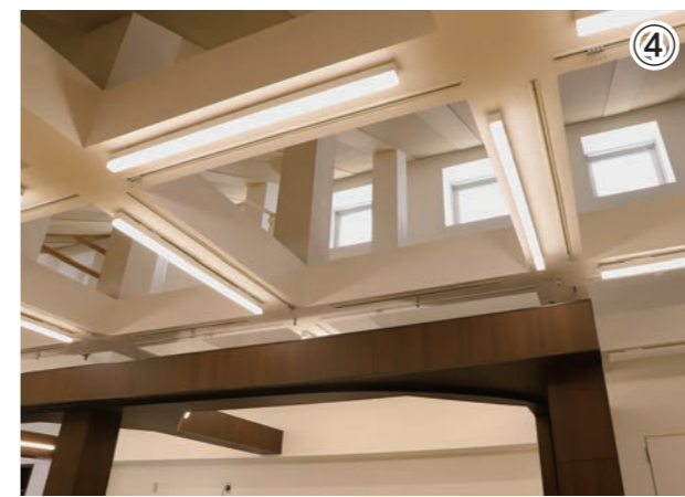
▲SDGsへの取り組みとして、施設内の照明をLED照明に改修しました。以前より明るく清潔感のある室内になりました。