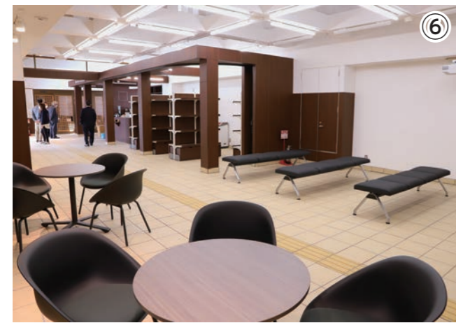
▲ゆとりができた待合スペース。電車の待ち時間にぜひご利用ください。