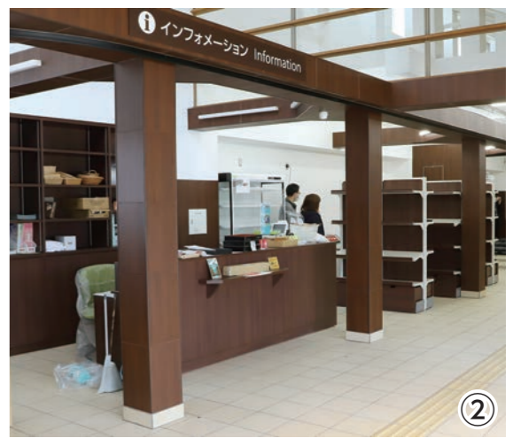
▼広くなった売店コーナー。大石田町、尾花沢市の特産品や、お土産品など多数販売しています。