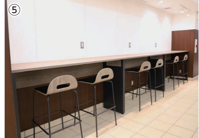
▼コンセント・Wi-Fi完備。電車の待ち時間に仕事や調べものができる空間。