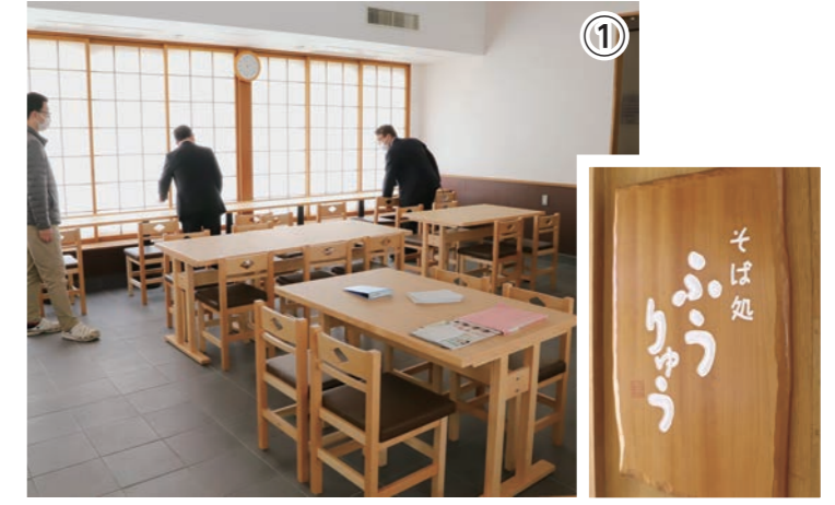
▲そば処「ふうりゅう」。靴を脱がずにご利用いただけます。