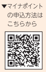
マイナポイントの申込方法は こちらから

町立歴史民俗資料館収蔵の民具を鷹巣分館(旧鷹巣小学校)にて公開します。大石田に生きた人々の足跡をたどってみませんか。マスクを着用してお越しください。(水道、電気、トイレが使用できませんので、あらかじめご了承ください。)