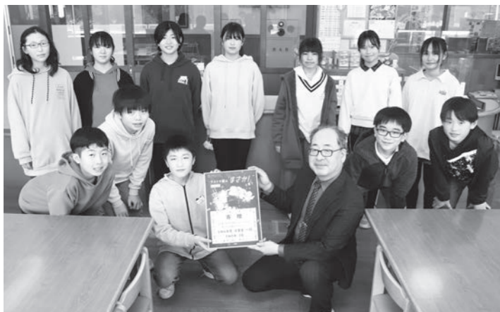
▼大石田北小の皆さん