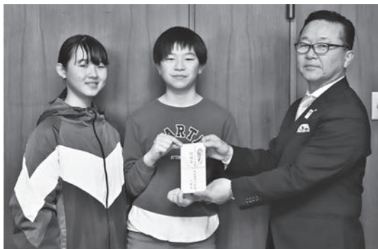
▲大石田南小の皆さん