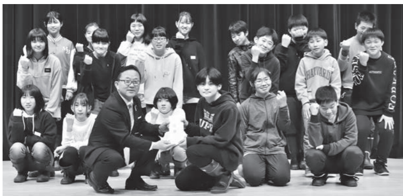
▲大石田小の皆さん