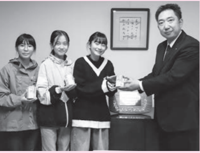
大石田北小学校のみなさん