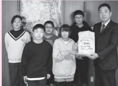
大石田小学校のみなさん