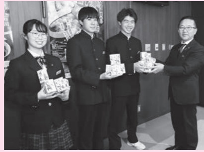
大石田中学校のみなさん