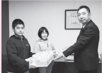
大石田南小学校のみなさん