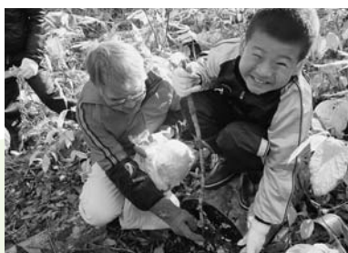
→昨年10月のふるさと訪問。なめこ狩りと新そばを楽しむました。