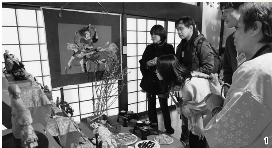
1 / 外国風の人形も並ぶ常盤家の雛飾り。 2 / 草刈家の雛飾りは押し雛やつるし雛など天井に届くほどの高さに。3 / 榎本家の雛飾り。蔵座敷に飾られた優雅な雛をながめます。 4 / 高桑家の雛飾りは家の奥まで続く独特の土間「ろうず」から。5 / おいしい物産展「にぎりばっと」などさまざまな特産品が並びました。6 / 北村山高茶華道部による本格的な抹茶席。7 / 歴史民俗資料館にもさまざまな時代のおひなさまが並びました。8 / 食生活改善推進員の軽食コーナー。春の風に漂う香ばしい焼きおにぎりの香りが食欲をそそります。9 / 佐藤家の蔵座敷で開かれた「蔵」コンサート10 / 庄司家の雛飾り。自慢の漬け物を味わいながら。11 / 戸田家の雛飾り。ひな段にはケーキなども。

大石田ひなまつりは各家庭に飾られたお雛様を見てまわる「おひなみ」という形式のひなまつり。最上川舟運によってもたらされ、それぞれの家庭で大切に守り継がれてきたおひなさまが女性たちの手によってかわいらしく飾られます。訪れた方は、漬け物やくしら餅などでもてなしを受けながら、じっくりとながめていました。