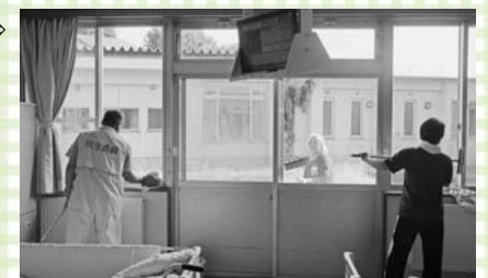
仁風荘での清掃活動⇒

民生委員はこれからも地域の福祉増進のため、地域の皆さんと積極的に関わっていきます。