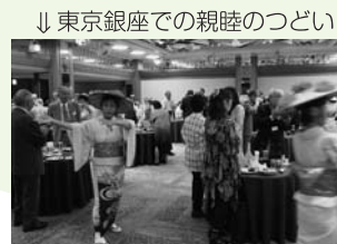
↓東京銀座での親睦のつどい →年3回町の広報紙などを送り、ふるさと話題をお届けします。

首都圏に在住する大石田町出身の方や大石田町を愛する方々で組織している「首都圏大石田会」があります。秋にはふるさと大石田町を満喫する「ふるさと訪問」も行われます。 首都圏に在住している大石田町出身者や家族が大石田町出身者の方はもちろん、「大石田町を好きな方」なら誰でも入会できます。 ぜひ、ご家族や親戚、友人に呼びかけてください。