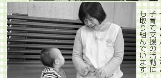
ぞうさんルームなど子育て支援の活動にも取り組んでいます。