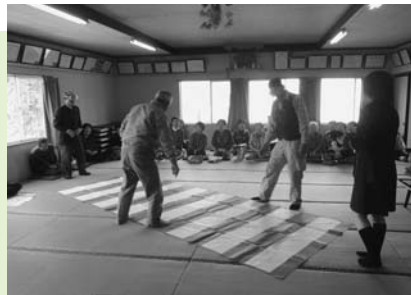
四日町公民館で行われた交通安全教室の1コマ。視界がゆがんで思い通りに歩けません。

各地区の老人クラブなどでの交通安全教室で、飲酒状態の疑似体験を行っています。酔ったときの視界を体験できる「飲酒状態体験ゴーグル」をかけ、横断歩道に見立てたシートの上をうまく渡れるか体験してもらおうというもの。