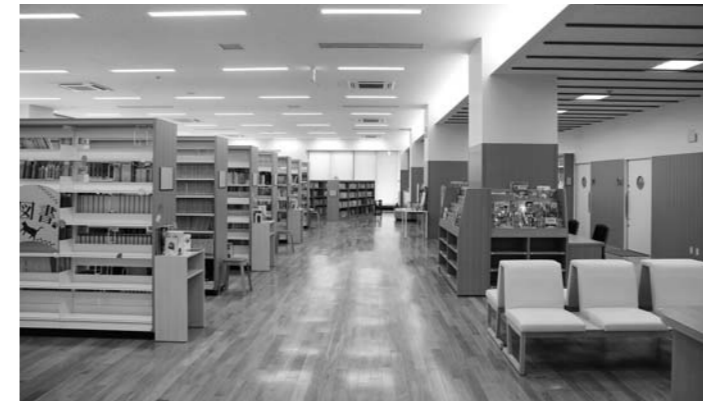
大人から子どもまでどなたでも利用できます。約4万冊が町民みなさん一人ひとりの本です。

各コーナーに図書の紹介スペースを設けています。あなただけのお気に入りの一冊がきっと見つかります。調べもののお手伝いもいたします。ぜひ職員までお声掛けください。