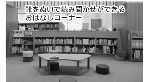
靴をぬいで読み聞かせができるおはなしコーナー

2階には郷土資料やPC持込み可能スペース、閲覧スペースがあります。有料ですが資料のコピーサービスも行っています。詳しくはカウンターまでどうぞ。