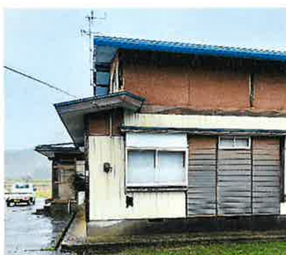
東側からの写真になります。