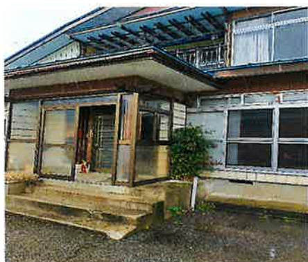
玄関の写真になります。